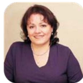
Цыплакова Елена, Народная артистка России